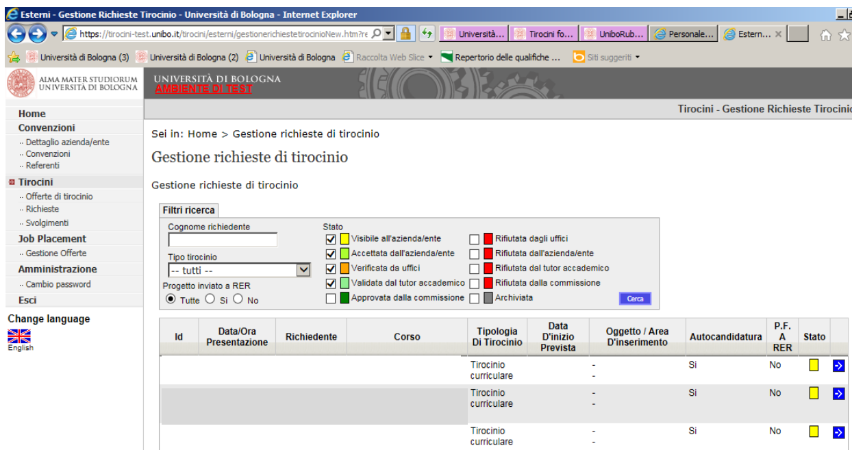
Fig. 2a – Visualizzazione richieste di tirocinio

Utilizzare la freccia blu per visualizzare la richiesta completa ed il CV dello studente